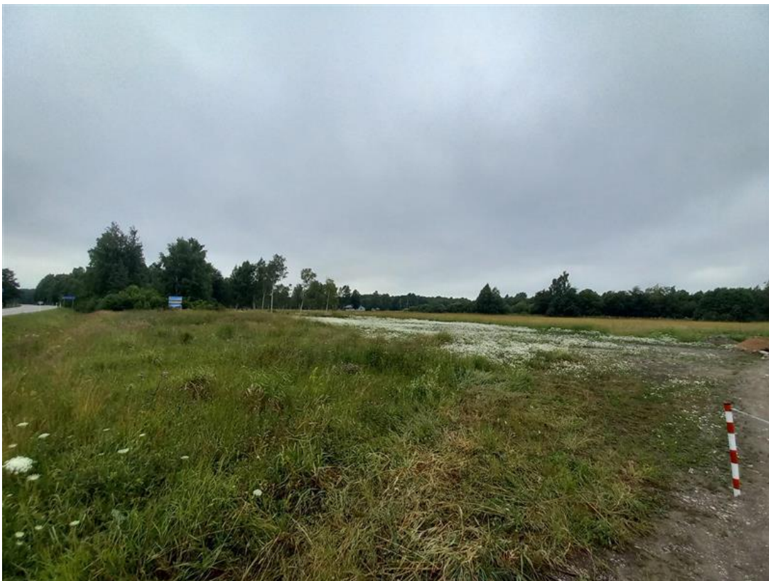
Joonis 4. Vaade Sõrve mnt 70 ja Teeääre kinnistutele Sõrve mnt 70 kinnistul olevalt sissesõiduteelt.