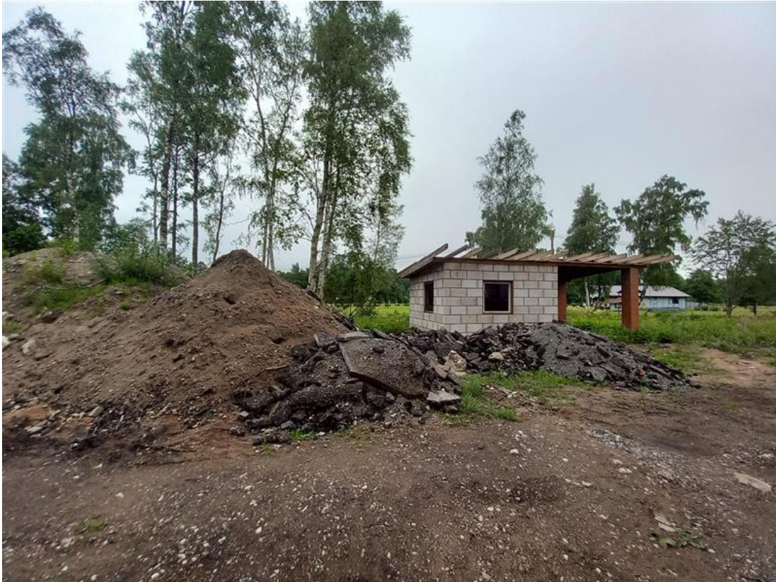
Joonis 3. Ohaka 2 kinnistul paiknev ebaseaduslik ehitis ja ladustatud pinnas.