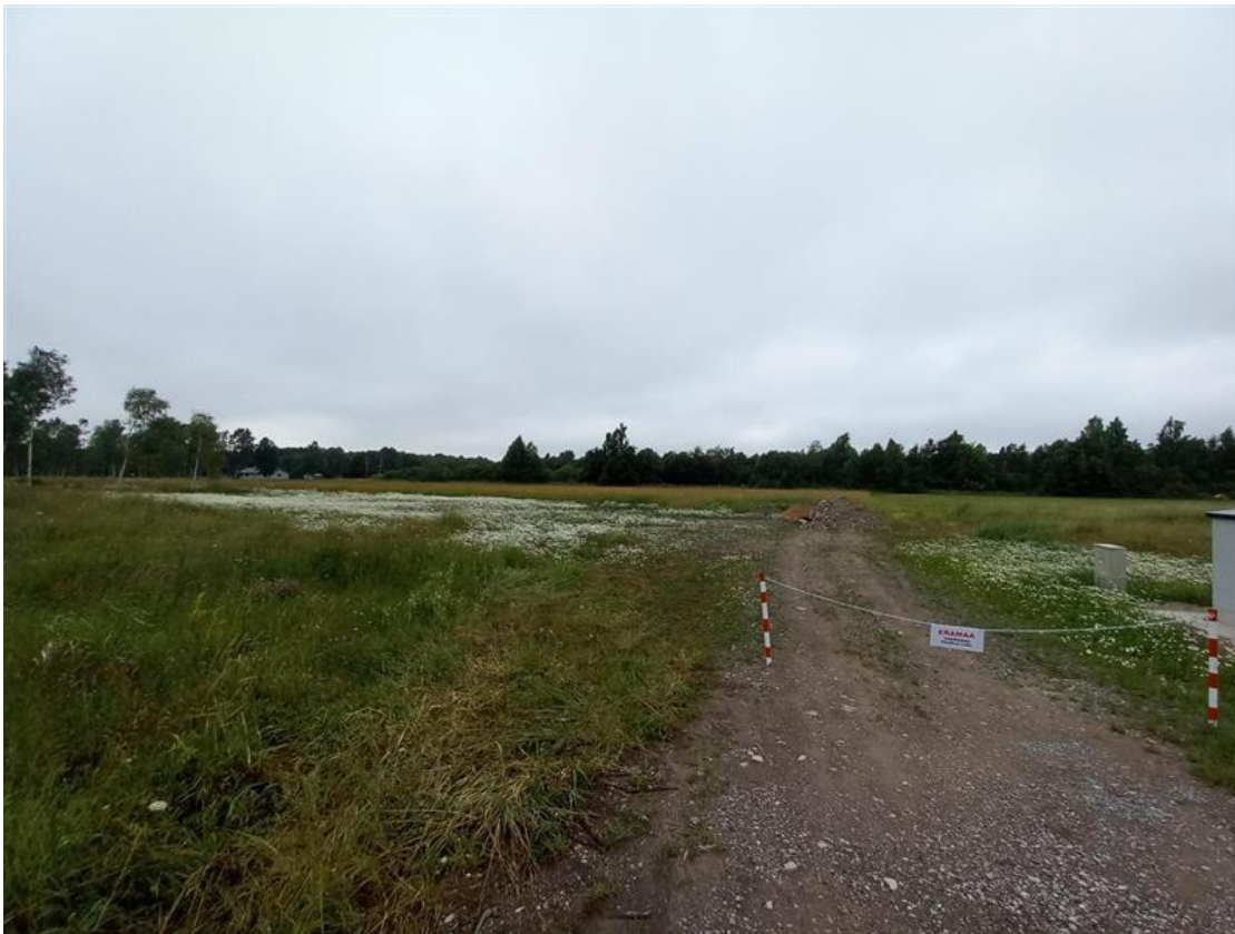
Joonis 6. Mahasõit Kuressaare-Sääre teelt vaatega põhja suunas. (, 01.07.2024)