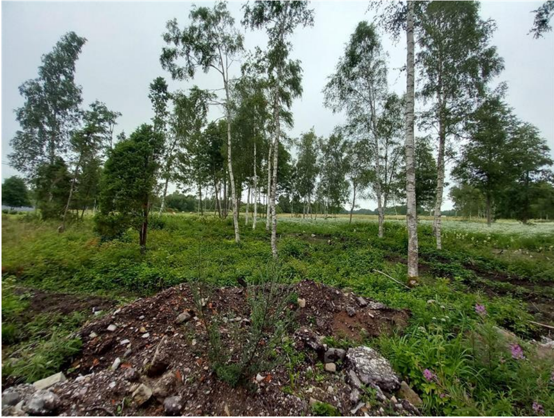
Joonis 5. Planeeringuala Ohaka tee 2 kinnistult vaatega ida suunas.