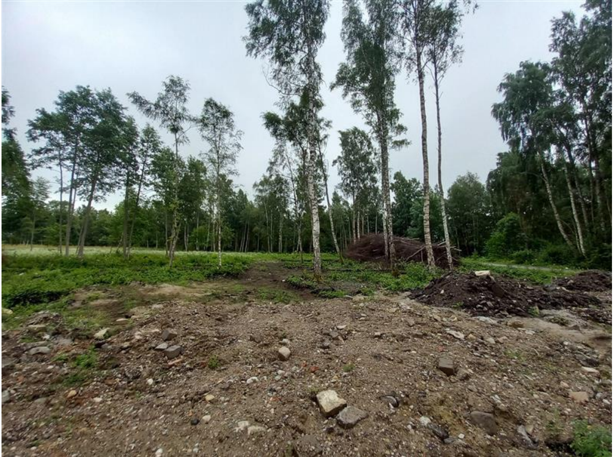
Joonis 2. Vaade planeeringualale põhja poolt. Paremalt Ohaka tee.

Planeeringualal ei asu vääriselupaiku, ega muid kaitsealuseid loodusobjekte, samuti puuduvad muinsuskaitsealused objektid ning kultuurimälestised. Planeeringuala on tasase reljeefiga, absoluutkõrgus jääb vahemikku 1-2 m.